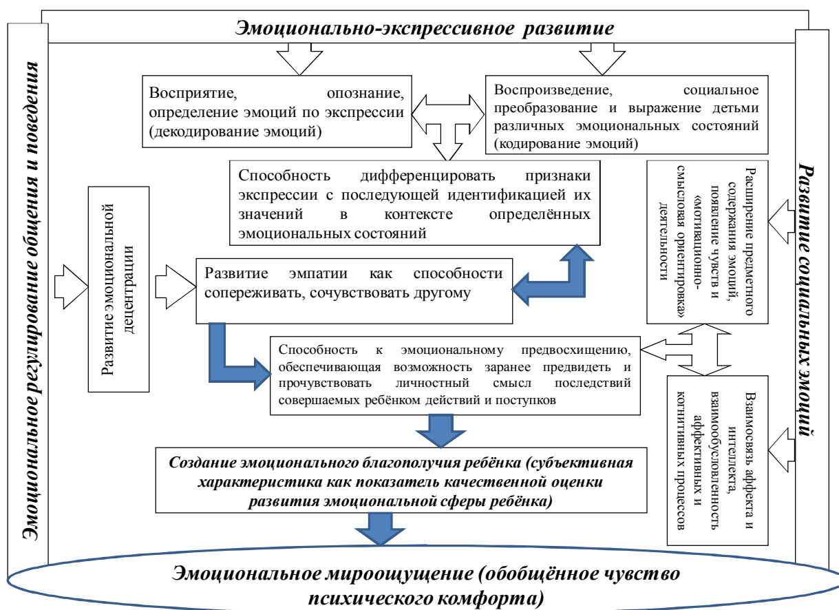
Рисунок 1 - Направления эмоционального развития детей дошкольного возраста

способности сопереживать, сочувствовать, содействовать чувству другого человека; 3) способность к эмоциональному предвосхищению. Появление вышеназванных эмоциональных новообразований обеспечено закономерными изменениями, происходящими в восприятии, распознавании, определении эмоций и их вербального воспроизведения детьми, а также в развитии эмоциональной децентрации, в усложнении и расширении предметного содержания эмоций, в появлении новых форм мотивационно-смысловой ориентировки деятельности, обобщении аффекта и интеллекта. Одним из ключевых показателей эмоционального развития рассматриваем мироощущение ребёнка в системе «Я - Мир», выступающее источником развития и «кристаллизации» эмоциональной сферы дошкольника. Результаты теоретических обобщений представлены на рисунке 1.